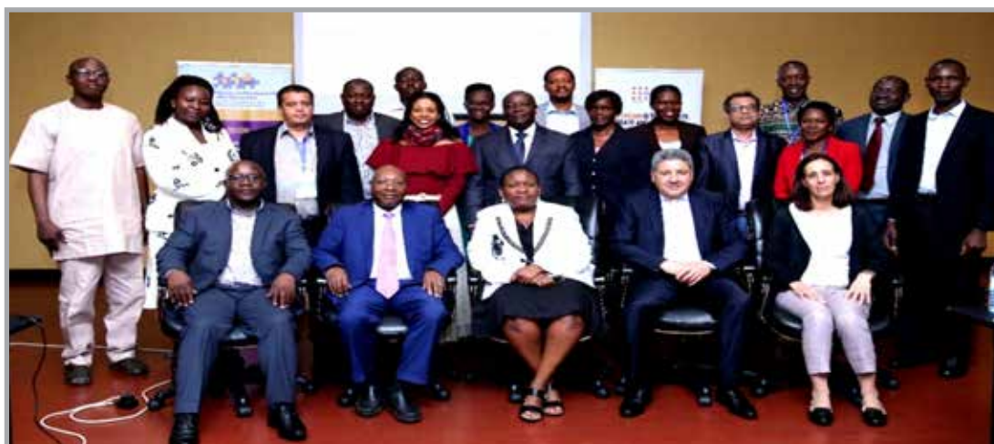
Coordinateurs des Pays Membres pour la région Afrique participants à la Réunion de Coordination, 1er novembre, 2018, Ouganda