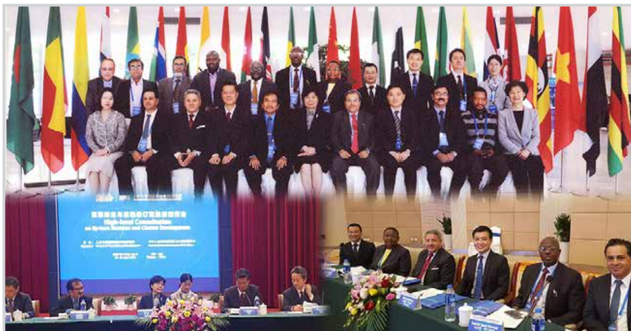
Consultation de Haut Niveau tenue à CTC, China

Depuis sa création, la gouvernance du PPD était régie par les dispositions de son règlement intérieur adopté lors de la première réunion du Conseil d'Administration à Harare en 1995. Les manuels de politique de gestion élaborés par la suite assuraient à la branche exécutive de l'Organisation le contrôle de la gestion. Avec l'expansion géographique continue et la multiplication des pays désireux d'adhérer à l'Organisation, un instrument complet régissant les questions de la Gouvernance et d'adhésion est devenu essentiel. Cela a également nécessité la révision des manuels de la politique de gestion afin de les rendre conformes à la nouvelle Charte. Conformément à la décision prise par le Conseil d'Administration lors de la 22ème réunion à Yogyakarta (Indonésie) en novembre 2017, le secrétariat du PPDs a élaboré le projet de Charte et proposé une révision du Manuel de La Politique par les experts juridiques et administratifs concernés et a recueilli les contributions, commentaires et réactions des pays membres par l'intermédiaire des coordonnateurs des pays partenaires CPP. Les projets de documents révisés ont été minutieusement examinés et finalisés lors d'une Consultation de haut niveau organisée au Centre de Formation pour la Santé de la Reproduction et La famille à Taicang, en Chine, du 25 au 26 avril 2018.