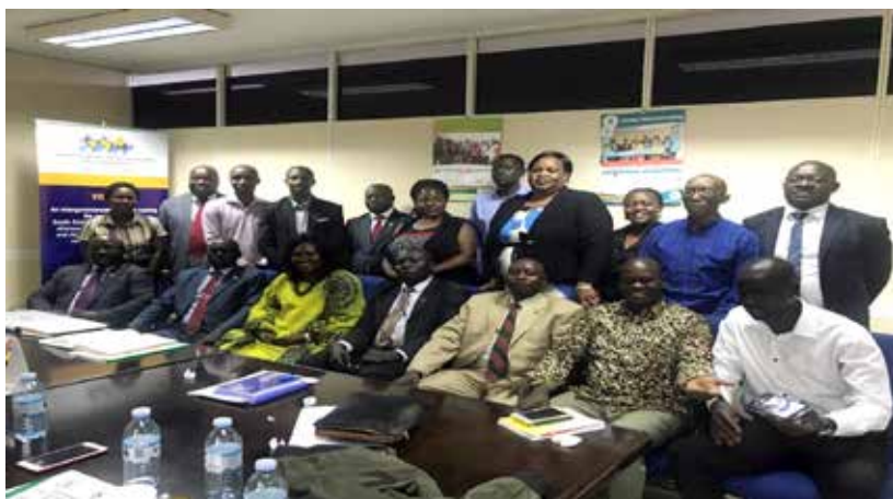
Photo de famille des participants lors d'une réunion avec une délégation de Parlementaires du Sud Soudan, 5 décembre, 2018

Le PPD ARO a reçu une délégation du Sud Soudan qui a rendu une visite au Ouganda pour évaluer les critères de bonnes pratiques inhérents au renforcement de la meilleure forme de CSS, créer des liens professionnels et de profit mutuel entre les Parlementaires, Gouvernements et Associations de la Société Civile. Les Membres de la Délégation ont profité de cette visite pour recueillir davantage d'informations sur l'engagement du PPD, au plus haut niveau, envers les Parlementaires et les décideurs Africains et notamment à travers le NEAPACOH et les avantages qu'il présente. Les organisateurs de cette visite pour inviter les Parlementaires à renforcer le processus de CSS avec les pays membres à l'échelle régionale, et pour l'intérêt pour leurs programmes nationaux de SG/PF et population.