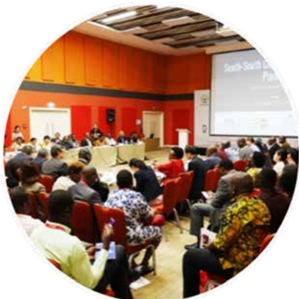
Participants at the Round Table

Cette table ronde a été une excellente occasion de présenter les réalisations du PPD au cours des 24 dernières années en mobilisant un soutien politique national et en augmentant les moyens financiers alloués aux programmes de planification familiale dans les pays membres et d'autres pays en développement grâce à la Coopération Sud-Sud et la Coopération Triangulaire.