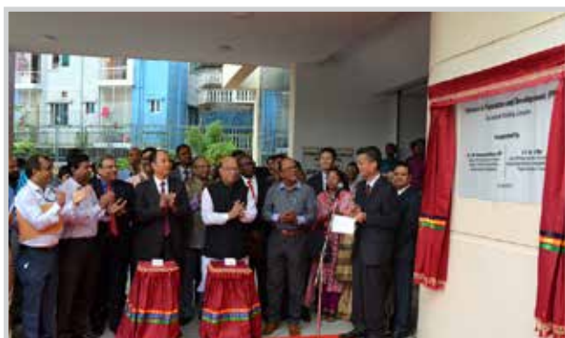
S.E. Mr. Mohammed Nasim, Député, et S.E. Mr. Wang Pei'an inaugurant le Complexe du Siège PPD en présence des Membres du Comité Exécutifs

Le complexe abritant le siège du secrétariat permanent du PPD a été inauguré le 23 juillet, 2018, en marge de la tenue de la 31 ème réunion du Comité Exécutif du PPD, qui constitue la réalisation phare du PPD vers la collaboration vers l'institutionnalisation de la Coopération Sud-sud sur la base de la santé génésique, la population et le développement à l'échelle mondiale. Le ruban officiel de l'inauguration du complexe a été coupé par S.E. le Vice Ministre Mr Wang Pei'an, représentant le Président du PPD S.E. Li Bin, S.E. Vice Présidente de la Conférence Consultative Politique de la République Populaire de Chine (CCPRC), et S.E. Mohamed Nasim, Député, Membre du Conseil et du Comité Exécutif du Bangladesh, S.E. Ministre de la Santé et du Bien-Etre de la Famille du Bangladesh, en présence de tous les Membres du Comité Exécutif, de hauts responsables officiels du Gouvernement du Bangladesh, des représentants des agences locales des NU, des responsables de la Société Civile, des diplomates les représentants des media et d'autres personnes influentes.