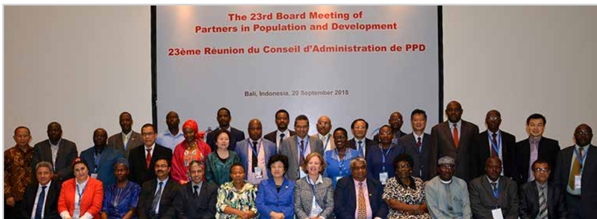
Les membres du Conseil du PPD et PCCs lors de la 23rd Réunion Annuelle du Conseil à Bali