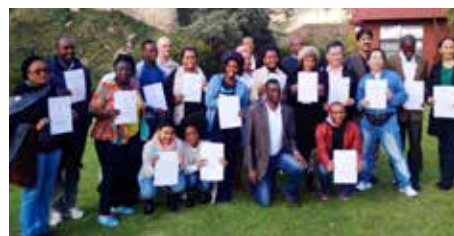
Photo de groupe des bénéficiaires de bourses PPD

Initié en 1998, le programme de bourses PPD est un programme phare qui contribue grandement au développement des ressources humaines dans les pays membres, et ce en renforçant l'esprit de direction et le renforcement des capacités des professionnels concernés par les programmes de développement et l'octroi de services en RH et PF. En 2018, le PPD est intervenu pour faciliter l'octroi de 27 bourses à des candidats de pays membres, avec le concours des Gouvernements de l'Inde, l'Egypte et l'Afrique du Sud.