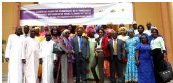
Photo de famille des participants lors d'une réunion de suivi avec les Membres du Parlement du Sénégal à propos des engagements NEAPACOH, le 5 juillet, 2018, à Dakar, au Sénégal

Au Sénégal, plus de vingt parlementaires et membres de la Commission de la Santé au Parlement Sénégalais, ont organisé une réunion conjointe avec le PPD ARO, pour évaluer le progrès réalisé à propos des indicateurs d'amélioration des conditions de santé et analyser les défis qui restent à relever pour l'application des engagements SG/PF pris afin d'atteindre les objectifs de santé nationaux et internationaux. Les Membres du Parlement ont convenu de créer un groupe critique de leaders comprenant des Parlementaires, des membres de la société civile et des technocrates conduit par le 4 ème Sous-Président de l'Assemblée nationale pour soutenir la mise en oeuvre du PF2020 et autres programmes PF/SG, et ce conformément aux engagements que le pays a pris sur son compte devant les instances nationales et internationales.