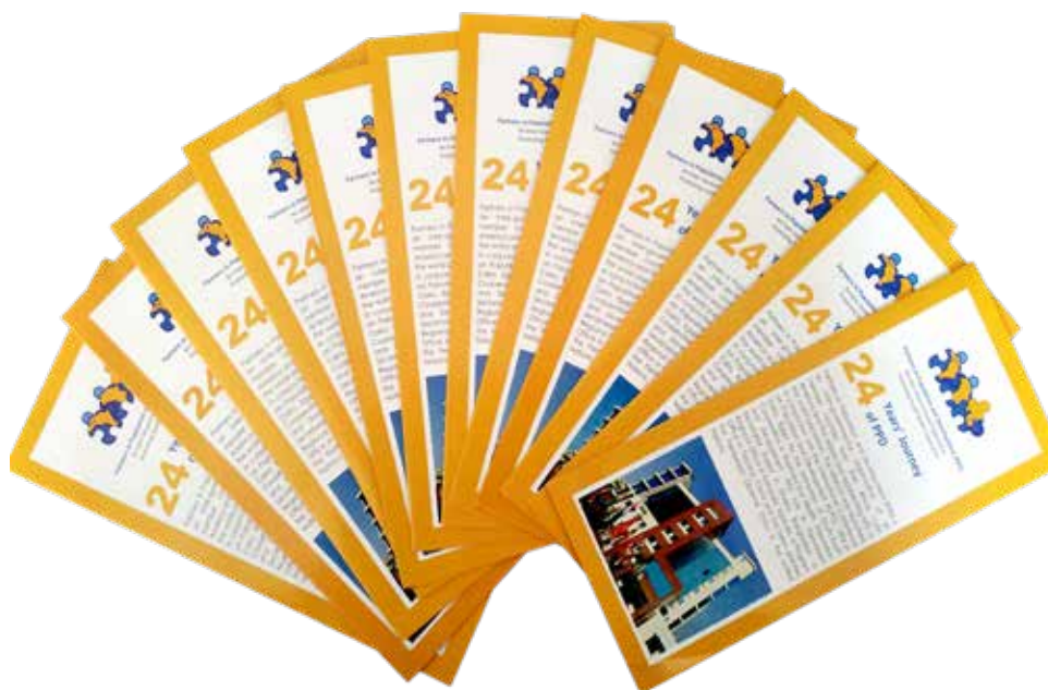
Brochure illustrant 24 ans d'histoire du PPD

Pour visionner le film vidéo, veuillez visiter - https://youtu.be/8zjF3vvTru0