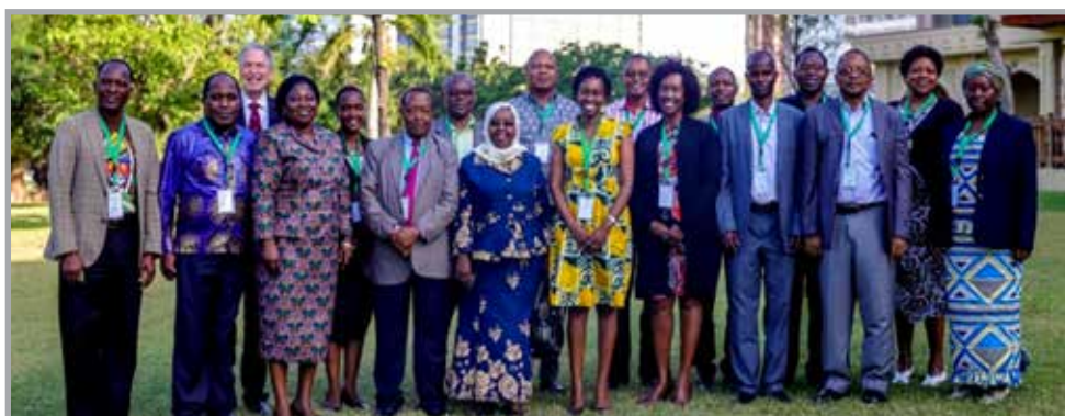
Participants à la réunion des acteurs régionaux pour l'utilisation des preuves pour la prise de décision, Dar es Salaam, Tanzanie

Le PPD ARO a participé à une réunion régionale sur l'utilisation des preuves pour étayer les résultats dégagés dans le domaine de la santé maternelle et infantile, tenue le 20 juin, à Dar-Es-Salem, Tanzanie. Cette réunion a vu la participation de responsables au ministère de la santé, des partenaires au développement, des associations de la société civile et des médias. La réunion s'est focalisée sur le thème précis suivant : mettre en exergue les interventions innovatrices mise en œuvre dans le cadre de l'initiative IMCHA pour relever les défis inhérents à la santé maternelle, partager les conclusions dégagées autour des interventions axées sur la communauté, qualité des soins de santé au niveau de la famille, et les ressources humaines relatives à la santé. Les participants à cette réunion sont sortis avec cinq recommandations prioritaires formulées sur la base des preuves et améliorer les conditions de santé maternelle et infantile en Tanzanie. Ils font recours à la santé m-technologie à travers les employés (CHWs), encourager l'implication masculine, renforcer les compétences de gestion dans le domaine de la direction des programmes de santé, créer des sites de simulation pour préserver les compétences cliniques, et renforcer les services de stage interne de trois mois axés sur CEmONC et programmes d'anesthésie.