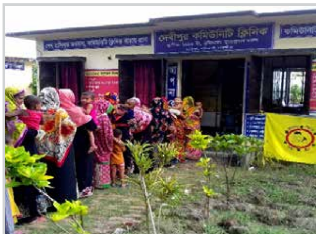
Services de soin prodigués par les cliniques communautaires au Bangladesh

Services prodigués par les cliniques communautaires Education et conseil dans le domaine de la santé maternelle et néonatale Gestion intégrée des maladies infantiles Santé génésique et planning familial EPI, ARI, CDD Supplémentation micro-nutritionnelle Dépistage des maladie non transmissibles avec transfert pour bénéficier de services de soin meilleurs