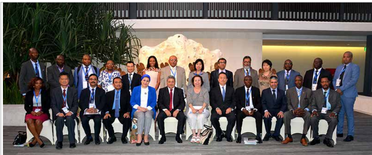
La 20 ème Réunion de Coordinateurs des Pays Partenaires à Bali

La 20 ème Réunion Annuelle du CCP ET des Institutions Partenaires s'est tenue le 19 septembre 2018 à Bali en Indonésie, en présence de CCP de 21 pays membres. Les CPPs ont examiné et révisé le projet de plan de travail du PPD pour l'année 2019, la déclaration conjointe du DPP et du FNUAP pour la 23 ème réunion du Conseil et l'Appel à l'action de Bali. Les CPPs ont également débattu de l'évaluation des capacités des interlocuteurs en matière de promotion des activités de la Coopération Sud-Sud et de l'enquête PPD / FNUAP sur la contribution de la Coopération Sud-Sud à la mise en œuvre du Programme d'Action de la CIPD, y compris les Objectifs Mondiaux concernés par la santé et la population.