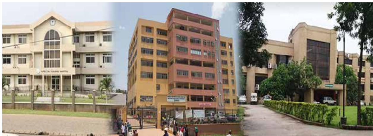
Des exemples d'hôpitaux choisis du Ghana, Ouganda et Bangladesh

Ouvrant conjointement avec les Coordinateurs des Pays Partenaires (CPP) des pays respectifs, le Secrétariat du PPD a identifié deux (2) hôpitaux de maternité, dans chaque pays, et auprès des points focaux, afin de mettre en œuvre les activités contenues dans le projet, et surtout celles qui se rapportent au renforcement des capacités, transfert de la technologie, les équipement et produits de base. Dans le cadre de ces projets, les efforts sont déployés pour disséminer les expériences réussies et faire prévaloir les bonnes pratiques et transformer ces projets en une vague de phases réussies dans d'autres pays membres.