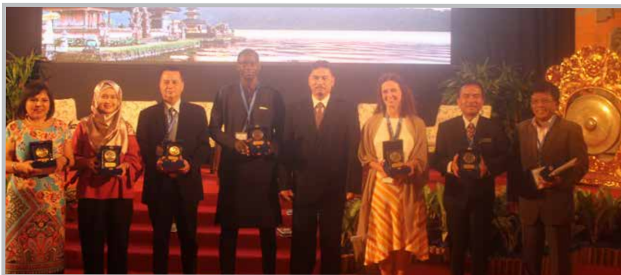
Les panelistes recevant leur bardeau à la fin de l'atelier