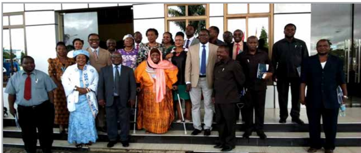
Une photo de famille des participants prise lors de la réunion conjointe PPD ARO/AFP, organisée pour les Parlementaires, à Dodoma, le 17 avril, 2018

Le PPD ARO a organisé une série de réunions de suivi avec la participation des Députés de la Commission de Santé qui ont assisté à la réunion NEAPACOH 2017, tenue à Kampala, Ouganda afin de faire l'état des lieux et évaluer le progrès réalisé à la lumière de la mise en oeuvre des engagements pris lors de la réunion NEAPACOH. Ces réunions ont été organisées avec le concours des Membres du Conseil PPD et des Coordinateurs des Pays Partenaires au Kenya et au Sénégal.