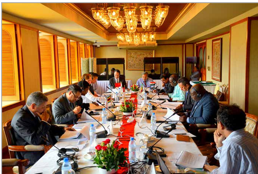
Les membres du Comité Exécutif du PPD lors de la 31ème réunion à Dhaka, Bangladesh

En marge de 31ème réunion du Comité exécutif (EXCOM), les membres du Comité Exécutif, accompagnés par des invités locaux composés de dignitaires du gouvernement, d'Agences des Nations Unies, de Missions Diplomatiques et de Maisons de Presse ont inauguré le nouveau complexe de bâtiments du Secrétariat du PPD à Dhaka sous la direction de S.E. M. Mohamed Nasim, député, ministre de la Santé et de la Famille du Bangladesh et S.E. M. Wang Pei'an, Vice-Ministre de la Commission Nationale de la Santé de la République populaire de Chine.