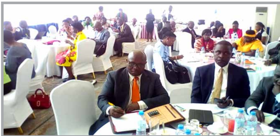
Des petits déjeuners débats sur l'importance qu'il faut réserver aux agendas de développement avec les Députés parlementaires en Ouganda

Ouvrant en partenariat avec les acteurs clés, le PPD ARO a organisé une série d'activités de plaidoyer focalisées sur les principaux objectifs suivants: s'assurer que le Gouvernement de l'Ouganda compte allouer un montant de 5.5 millions pour l'acquisition de produits de PF au cours de l'exercice financier 2018/19 et respecte un engagement financier renouvelé FP2020, honore un engagement NEAPACOH appelant le Parlement à approuver un programme d'Assurance Médicale Nationale qui comprend un volet de Planning Familial au mois d'octobre 2018, et garantir la reddition des comptes relatif à l'allocation du budget pour le programme FP/SG pour s'assurer aussi que les fonds alloués sont dépensés pour acheter les vrais produits requis.